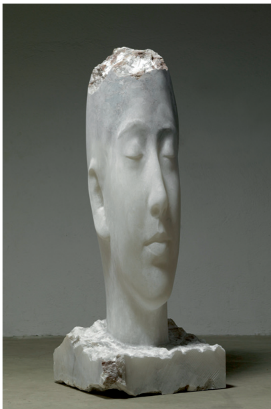
Jaume Plensa Cristina III 2010 Alabaster 167 x 65 x 65 cm Inv. 14872 © 2019 ProLitteris, Zurich

The exhibition is accompanied by a catalog published by Swiridoff Verlag.