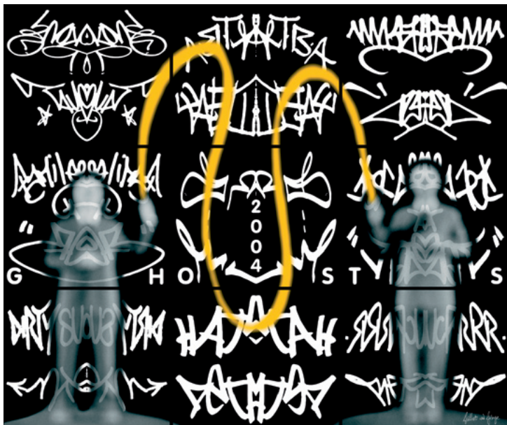
Gilbert & George Ghosts, 2004 Neun handkolorierte Silbergelatineabzüge / Nine hand-dyed gelatine silver prints 189 x 225 cm Inv. 15236